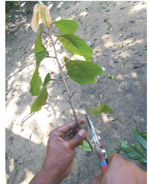
Foto 4. Branch kakawo pou fè grefon