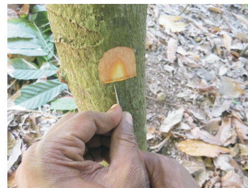
Foto 33. Tay vètikal kap fèt pou leve ekòs