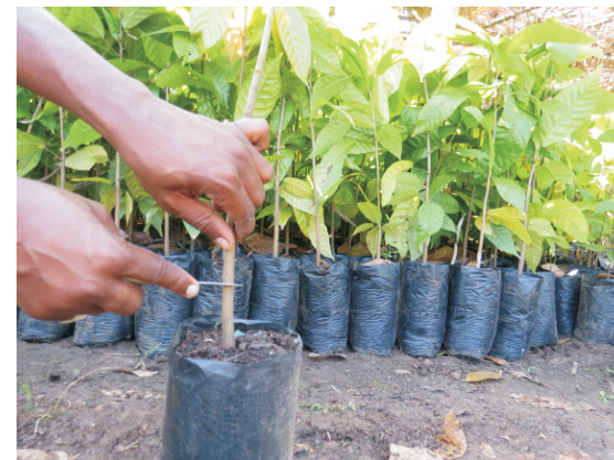
Foto 10. Koup sou kote pou detache ekòs pòt grèf