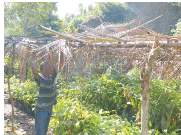
Foto 26. Plantè kap kwontwòl lonbray nan pepinyè

Kèk fwa li konn nesese pou dekouvri pepinyè prèske nèt pou lite kont imidite ak maladi.