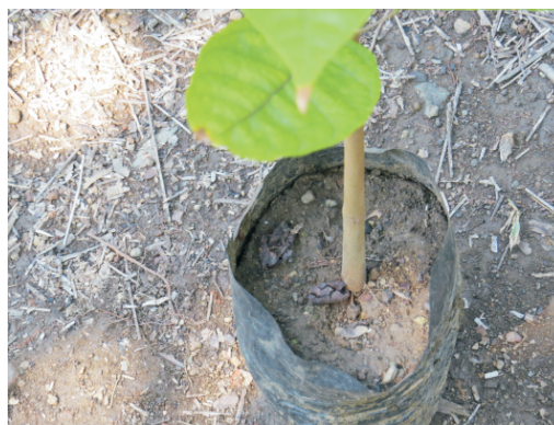
Foto 24. Ti plant ki pa twò devlope meta apa pou yo ka grandi