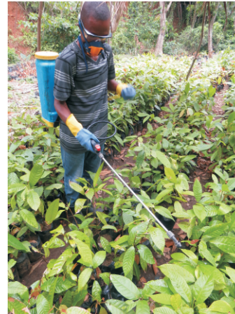
Foto 29. Pepinyè kap flite ak bon pwodwi pou Konbat maladi ak vèmin