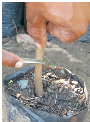
Foto 9. Premye koup kouche pou detache ekòs pòt grèf