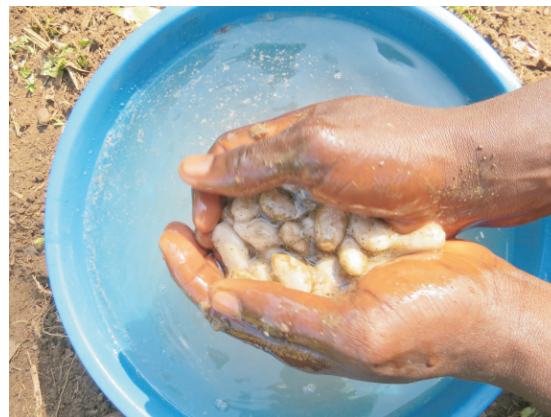
Foto 15. semans kap lave pou retire chè blanch avan yo simen