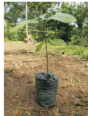
Foto 10. Bouch sachè ki te manke ranpli ki vin bouche

Pa bliye.: Gen sachè ki konn vini san twou oubyen twou yo plase move kote. Si nou gen sachè sa yo, nou dwe refè twou bon kote ladan yo.