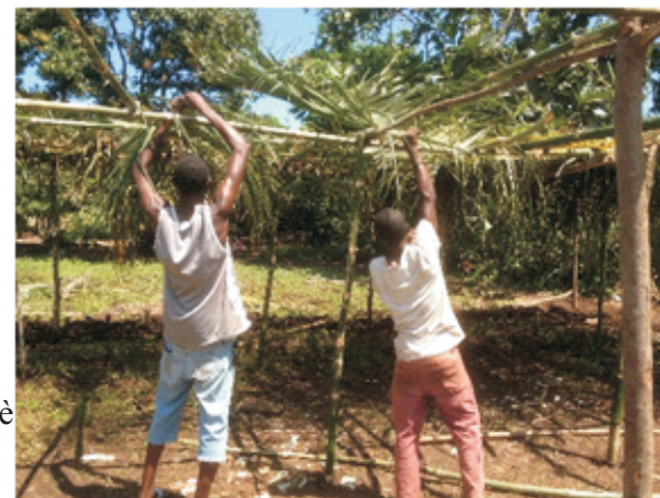
Foto 3. Tonèl bwa kap kouvri ak pay kokoye