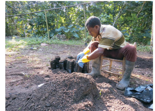
Foto 6. Pil materyo (Tè, Fimye, sann ak sab) fè melanj pou ranpli sachè