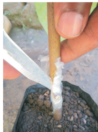
Foto 17. Riban plastik kap detache nan grèf