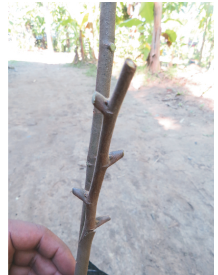
Foto 26. Grefon byen chita nan pòt grèf