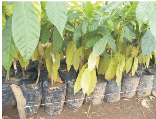
Foto 30. Grèf kakawo kap pouse avan pòt grèf yo koupe