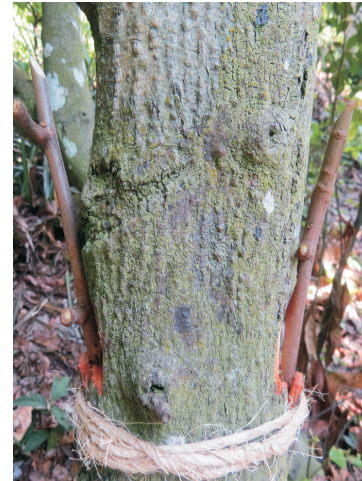
Foto 36. 2 grèf nan yon pye kakawo