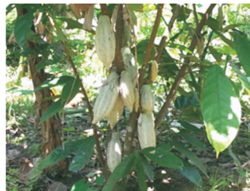
Foto 2.kakawo grefe kap donnen a laj 3 zan nan Komin Obòy