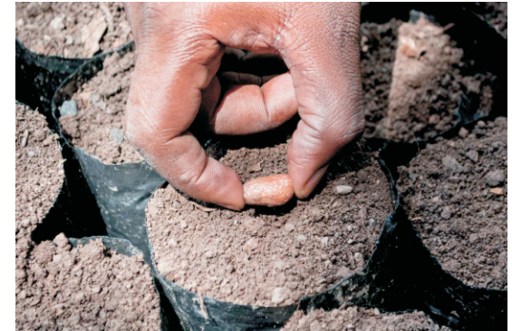
Foto 20. Kakawo ki jèmen kap simen kanpe ak jèm na tè