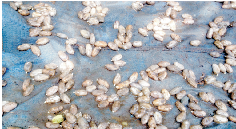
Desen 17. Semans kakwo fin jèmen nan jèmwa ki pra'l semen