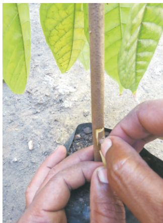
Foto 13. Grefon kap mete na pòt grèf

a. Mete grefon an nan ouvèti pòt grèf la.( Foto 12) Grefon an dwe chita nan pòt grèf la pou kanbyòm tou 2 byen kole youn ak lòt ( Foto 10)