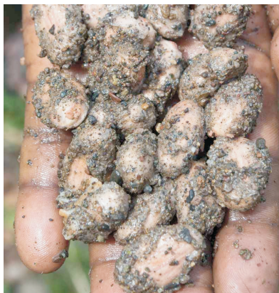
Foto 14. Semans kap fwotè nan sab pou retire chè blanch avan yal simen yo