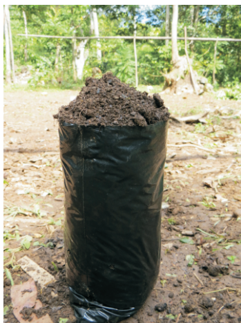
Foto8. Sachè ki twò ranpli