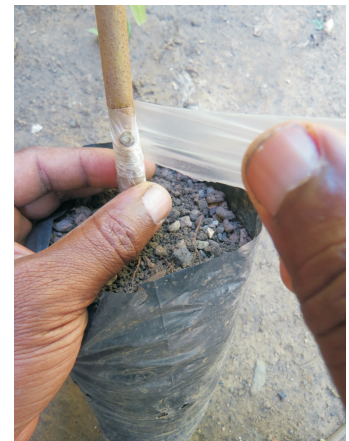
Foto 16. Grèf kap fin kouvri ak riban plastik