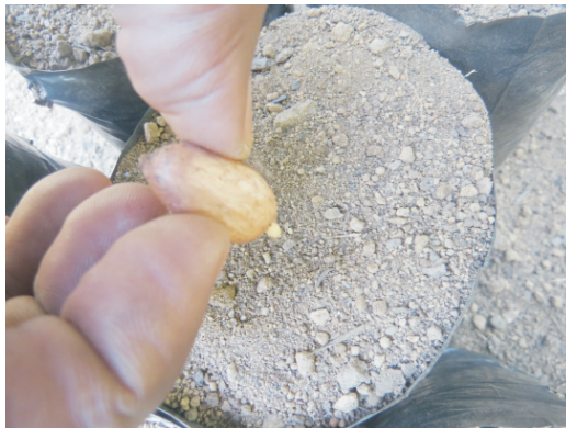
Foto 18. Kakawo ki jèmen kap simen kanpe ak jèm na tè