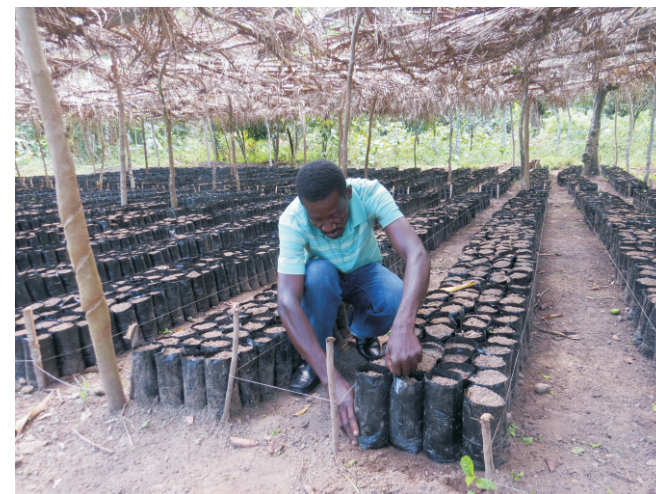
Foto 11. Pwodiktè kap enstale sachè pou fè pepinyè