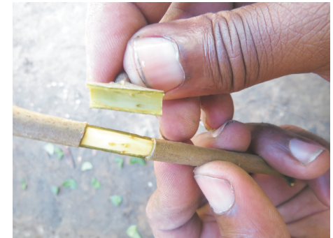
Foto 12. Grefon ki prepare pour grèf la