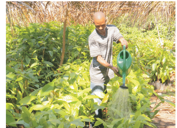
Foto 21 Yap wouze pepinyè ki gen plantil kap grandi nan pepinyè