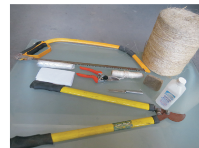
Foto 8. Zouti ki itilize nan grefaj kakawo