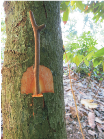
Foto 34. Grefon ak pòt grèf ansanm