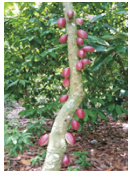
Foto 1. Pye kakawo ki byen donnen