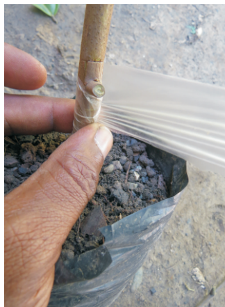
Foto 15. Yap kouvri grèf ak riban plastik

b.Kouvri ak mare grèf la ak riban plastik.Kòmanse kouvri ak plastik la anba pou monte ( Foto 15,16)