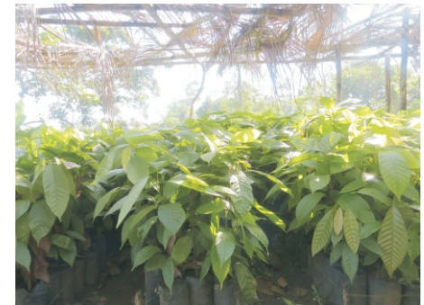
Foto 30. Plantil ki bon pou plante kap sevre. Tonèl la pa gen anpil pay.