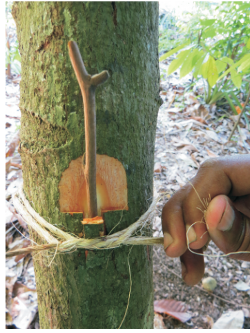
Foto 35. Grèf kap mare