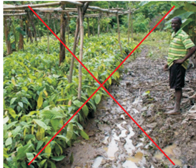
Foto 2. Pwoblèm nan pepinyè ki fèt nan tè ki kenbe twòp dlo