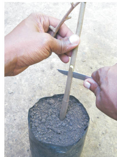
Foto 22. Ti pye kakawo kap taye pou fè grèf sou kote