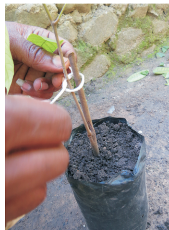
Foto 19. Grèf kap mare pou grandi nan direksyon anlè