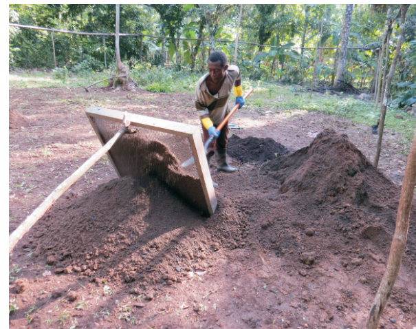
Foto 4. Materyo pou fè melanj kap pase nan tami pou retire wòch, moso bwa ak lòt bagay