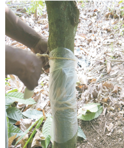
Foto 37. Grèf ki fin fèt kouvri ak plastik