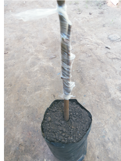
Foto 28. Grèf ki fin kouvri ak tep plastik