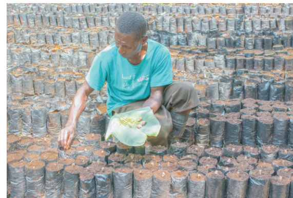
Foto 19. Kakawo jèmen simen san yo pa kouvri tout kò yo anba tè.