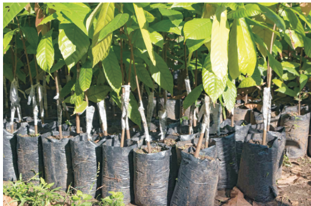
Foto 29. Kakawo grefe nan pepinyè