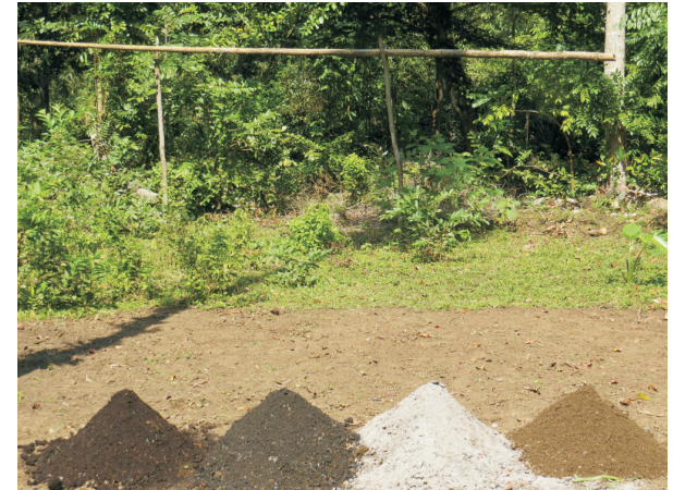
Foto 5. Pil materyo (Tè, Fimye, sann ak sab) fè melanj pou ranpli sachè