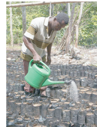
Foto 22. Yap wouze sachè yo apre yo fin simen kakawo