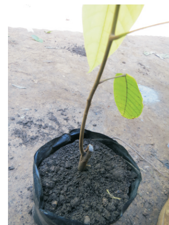
Foto 20. Pòt grèf ki fin taye e ki trete pou evite maladi