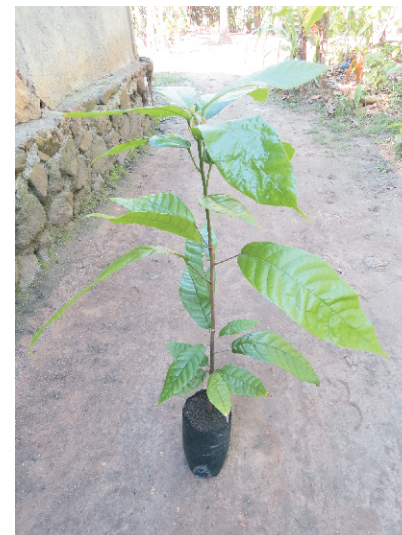
Foto 21. Ti pye Kakawo ki bon pou grefe