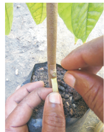
Foto 14. Grefon byen chita nan pòt grèf la. Yo te byen fè tay yo

b.Kouvri ak mare grèf la ak riban plastik.Kòmanse kouvri ak plastik la anba pou monte ( Foto 15,16)