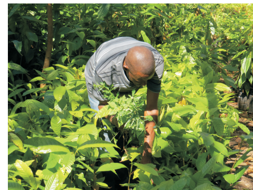
Foto 23. Semans ki pa jèmen ap simen kouchè

Tè nan sachè yo ka fè yon kwout anlè ki anpeche dlo ak lè rantr nan sachè yo. (foto 24) Nou dwe fè binaj pou kraze kwout sa yo (foto 25)