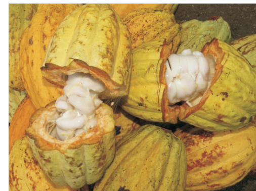
Foto 12. Kabòs kakawo mi pou fè semans