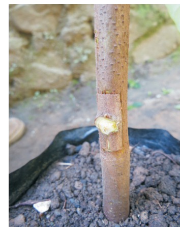
Foto 7. Grefon ak pòt grèf rete byen an kontak