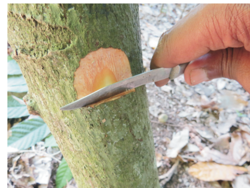
Foto 32.Foto . Premye tay nan gwo pye kakawo yo