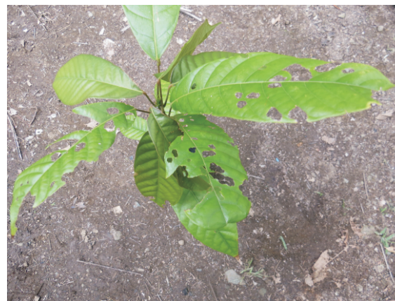
Foto 28. Dega kèk ensèk nan pepeinyè