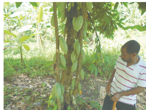
Foto 3. Pye kakawo byen donnen ki chwazi pou repwodwi