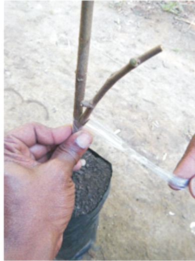
Foto 27. Grèf kap mare ak kouvri ak tep plastik