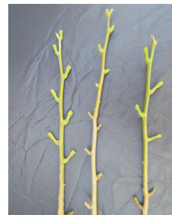
Foto 6. Fèy grefon yo koupe avan yo transpòte yo