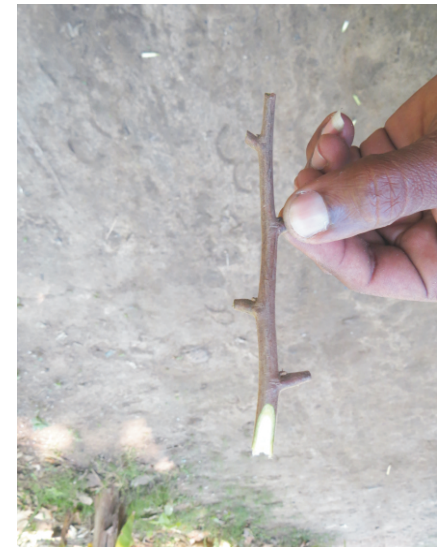
Foto 24. Grefon ki prè pou grefe