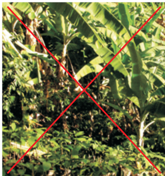
Foto 1. Pepinyè ki fèt anba twòp lonbray