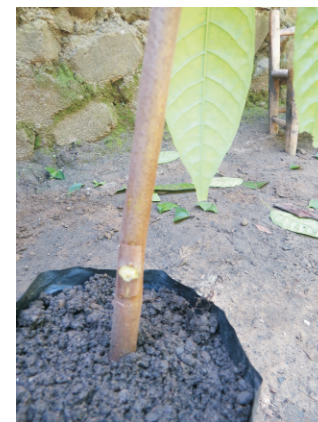
Foto 18. Grèf reyisi kap pouse boujon