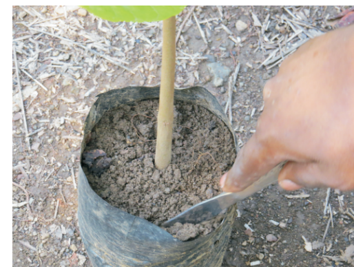
Foto 25. Binaj ki fèt pou kraze kwout tè nan sachè