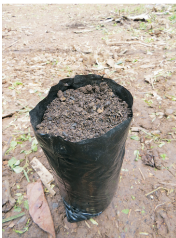
Foto 7. Sachè ki byen ranpli