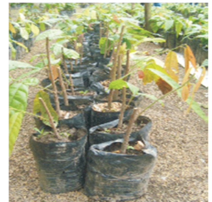
Foto 31. Grèf kakawo kap grandi apre pòt grèf yo fin koupe