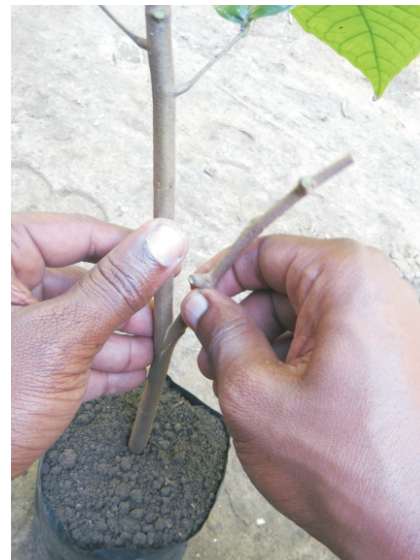
Foto 25. Grefon kap mete nan pòt grèf