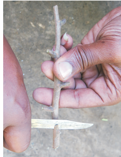
Foto 23. Grefon kap taye pou fè grèf