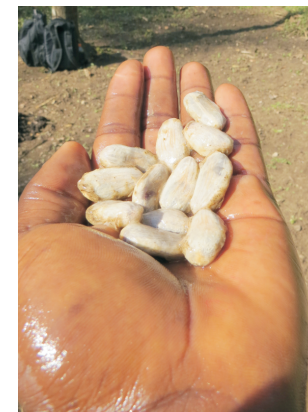
Foto 16. Semans kakawo ki fin lave ki bon pou simen