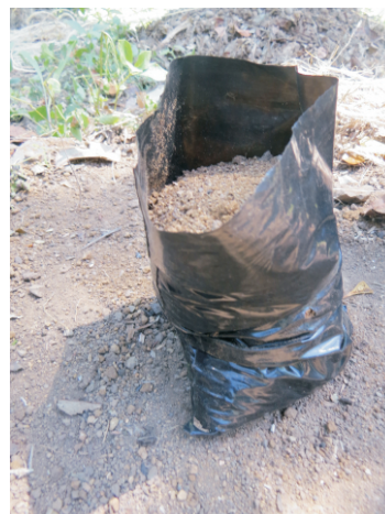
Foto 9. Sachè mal ranpli