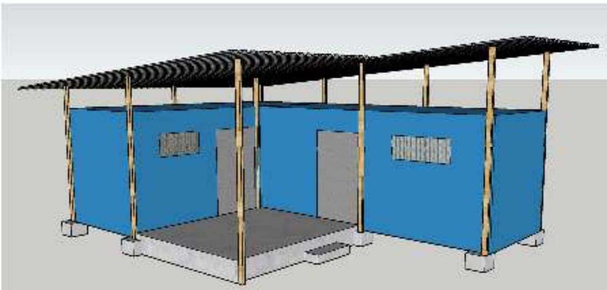
Figure 1 – Sketch of the rearing unit, front view. Concrete foundations for containers (6 blocks each), concrete square in front and roofing are not part of this RFQ but added for context.

The second container will house the prepupe and, pupae (need high humidity and ideally 28 degree C), potentially also nursery containers; there shouldn't be much light, just one window.