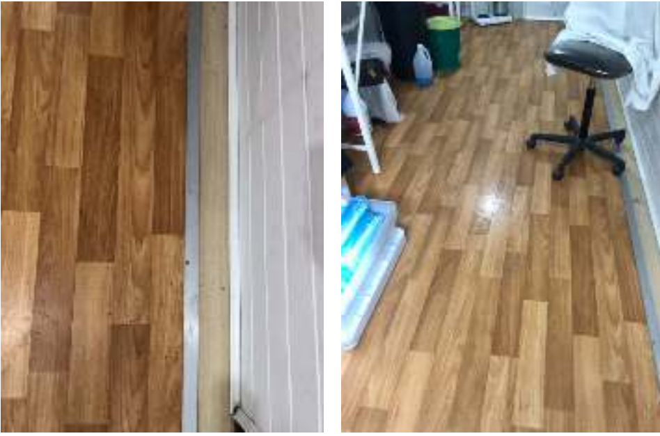
Figure 4 – Flooring with vinyl sheets.