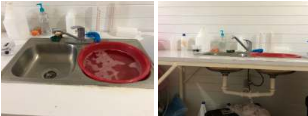
Figure 5 – Sink built into table.