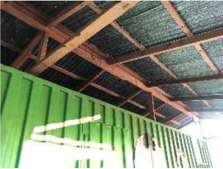
Figure 3 – Roofing with corrugated metal sheets and wooden piles/frame.